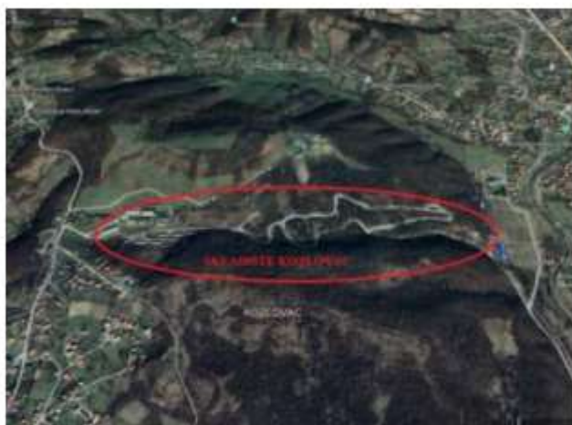
SL.1 Skladište Kozlovac Tuzla

U sklopu skladišta Kozlovac Tuzla postoji 18 objekata koje je potrebno obezbjediti sa vanjskom hidrantskom mrežom i potrebnim brojem hidranata. U sklopu kompleksa postoje dva hidranta, a vodosnabdjevanje je obezbjeđeno preko gradske vodovodne mreže.